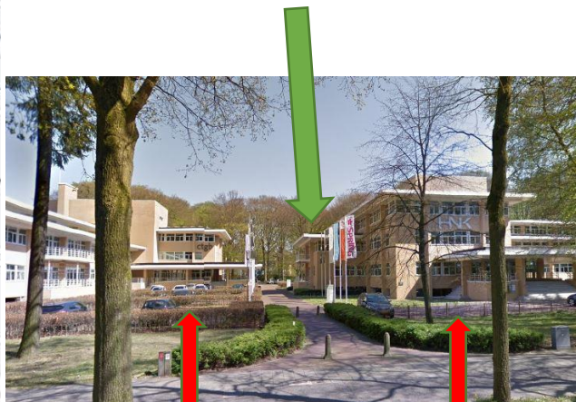
Route met de auto

Entree aan linkerkant van het rechtse HNK gebouw vanaf de Bennekomsweg gekeken