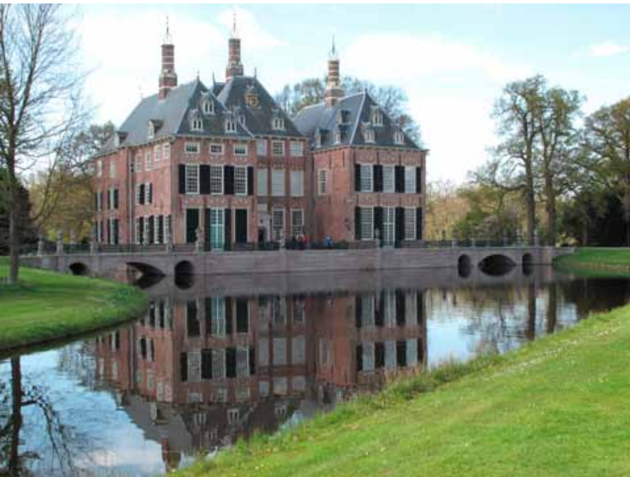
Links: Kasteel Duivenvoorde; cultureel erfgoed dat mede in stand kan worden gehouden dankzij de agrarische bedrijven op het bijbehorende landgoed.